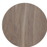
dark grey T